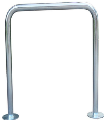
Rys. 1. Stojak dla rowerów

Powyższe parametry dotyczą jednego stojaka dla rowerów